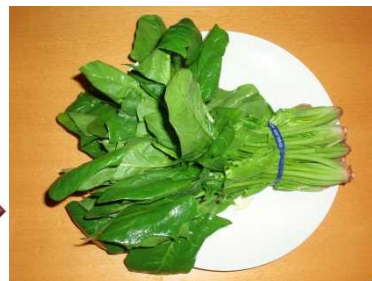
ほうれん草 1週間後