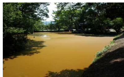
汚水池にセラミックスを散布