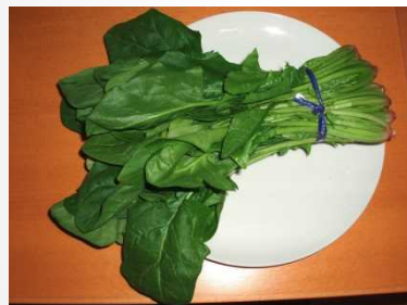
店から購入後ほうれん草