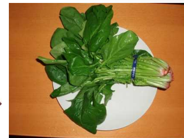
ほうれん草 2週間後