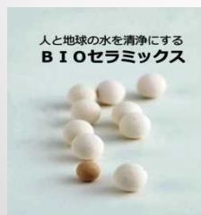
水質浄化セラミックス