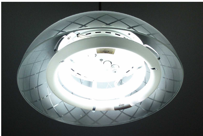
切れた電球の球は何年も、切れていた