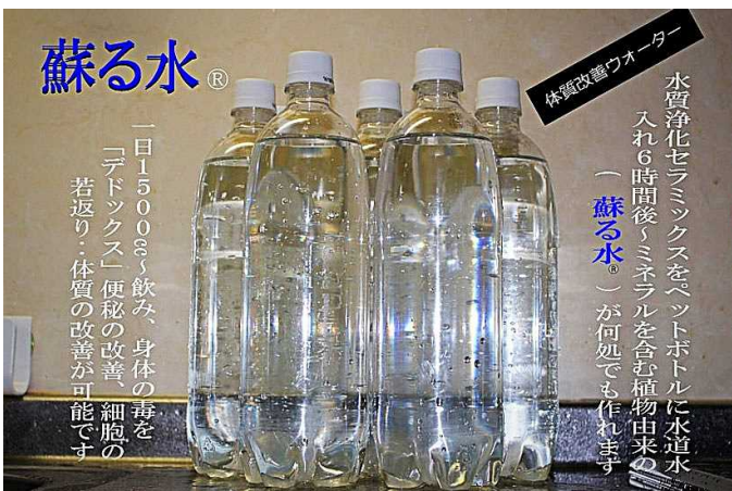
蘇る水の中には電子が含有 酸化結合分解洗浄