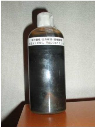
■ 錆で真っ黒の水道水の酸化する水