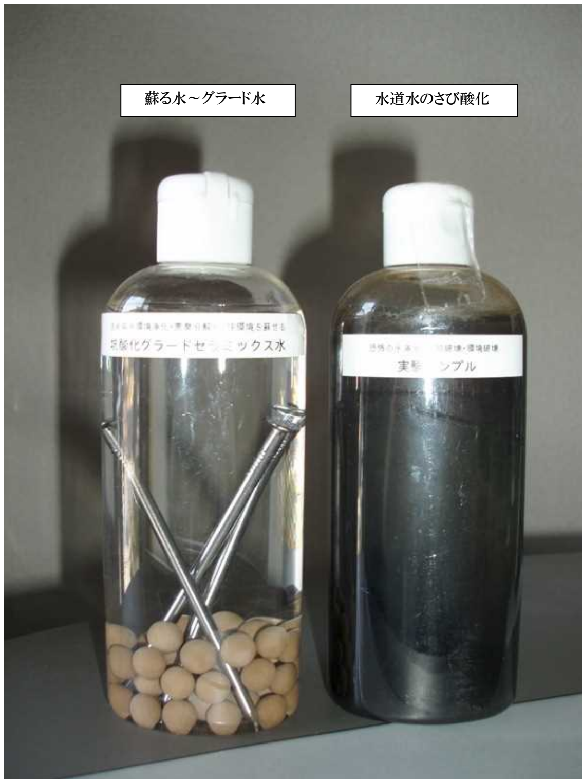
水道水のさび酸化