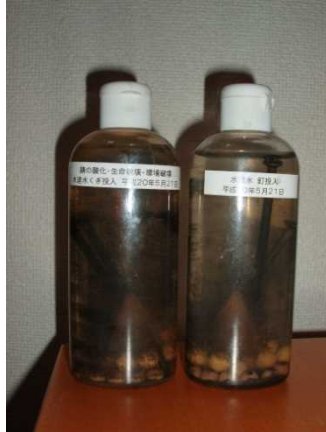
■ 錆を分解したセラミックの水